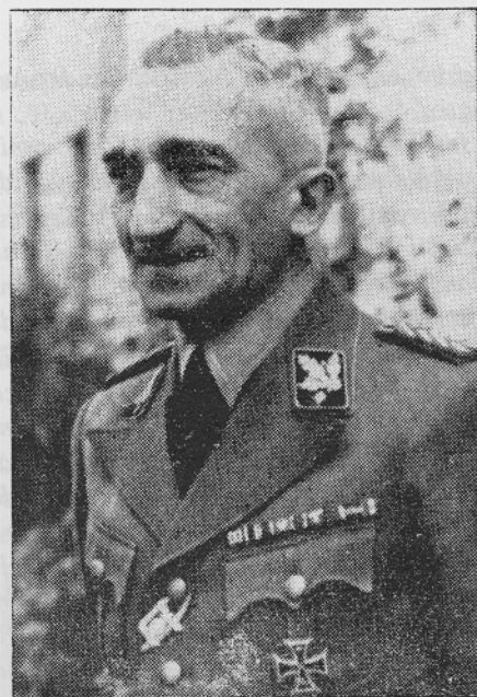
Arthur Nebe, Chef der Kriminalpolizei, General der Waffen-SS, Befehlshaber der Einsatzgruppe B bis Ende Okt. 1941