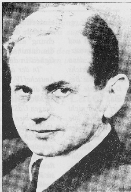
Otto Ohlendorf, Leiter der Einsatzgruppe D