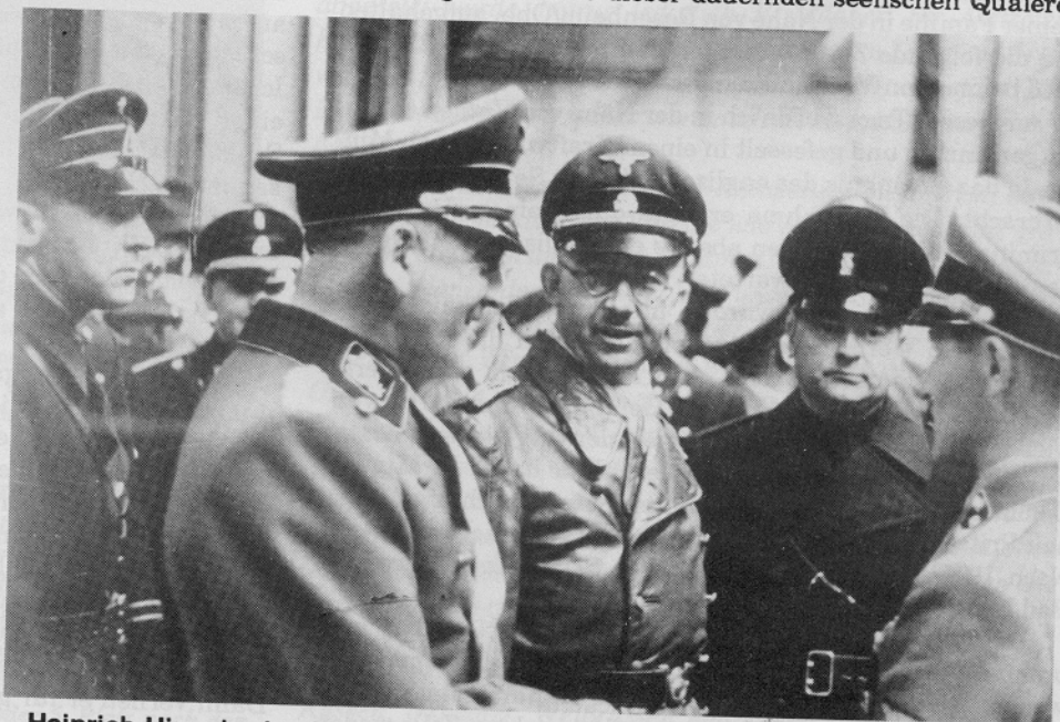
Heinrich Himmler im Gespräch mit Oswald Pohl und dem holländischen Führer der Nationaal Socialistischen Beweging (NSB), Anton A. Mussert