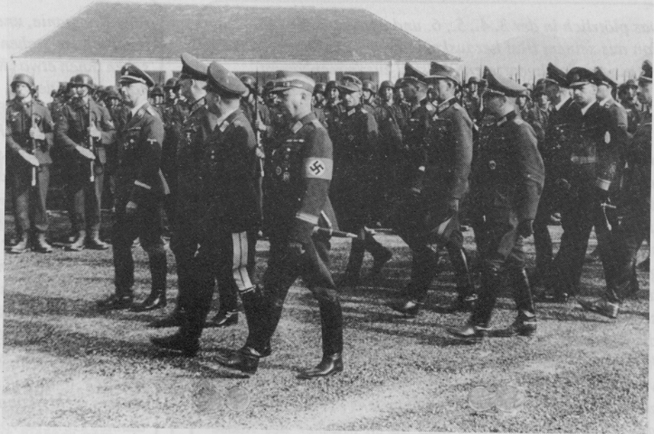
Staatsakt für Generaloberst Eduard Dietl in Kleßheim am 1. Juli 1944. Dietl war erster Eichenlaubträger der deutschen Wehrmacht (er erhielt diese Auszeichnung für seinen Kampfeinsatz 1940 in Norwegen/Narvik), seit Beginn des Rußlandfeldzuges Oberbefehlshaber der deutschen Truppen in Lappland/Finnland, am 23.6.1944 Flugzeugabsturz bei Salzburg.

Erfüllen Sie überall Ihre Aufgabe im Kleinen und Großen, dann haben Sie so gehandelt, wie das Gesetz es befahl."