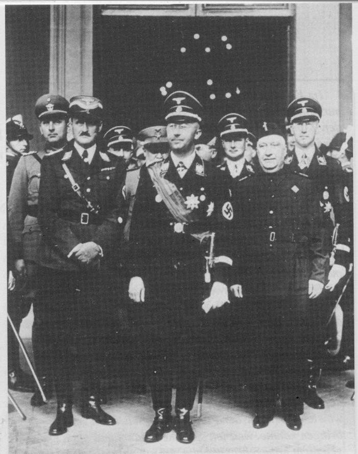
Ankunft des Reichsführers-SS und Chef der Deutschen Polizei, Heinrich Himmler, am 18.10.1937 in Rom. Er folgte einer Einladung des Duce zum "Tag der italienischen Polizei". In seiner Begleitung befinden sich die Chefs der Hauptämter Ordnungs- und Sicherheitspolizei, General Dalugue (li. i. B.), und SS-Gruppenführer Heydrich (re). Zur Rechten des RFSS beim Verlassen des Bahnhofs der deutsche Botschafter in Rom, von Hassell, auf der anderen Seite der Chef der italienischen Polizei, Bocchini.

Heinrich Himmler hat sicher versucht, im Frieden auf die kleine Verfügungstruppe einen Einfluß auszuüben. Im Kriege war das wenig oder gar nicht möglich. Truppenteile der Waffen-SS sprach er nicht. Er hat nur einige Male Kommandeure und Offiziere einzelner Divisionen im Felde gesprochen. Man