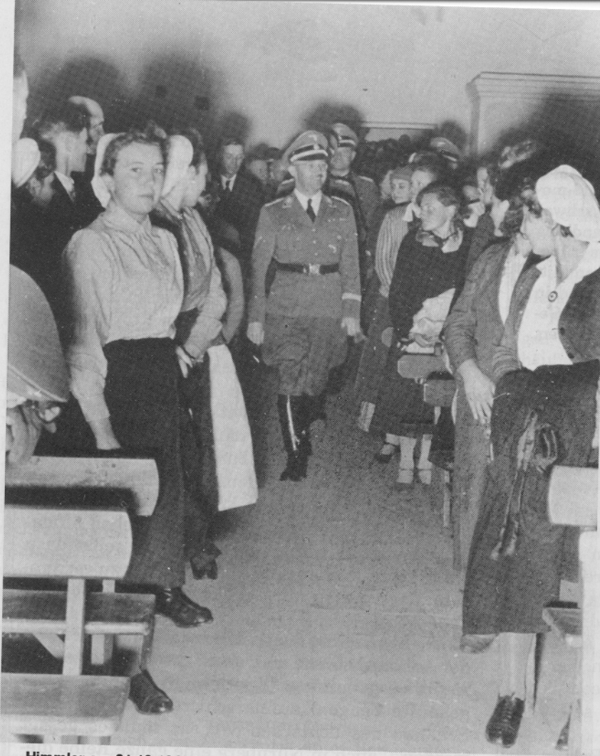
Himmler am 31.10.1942 beim Einzug in die Abendveranstaltung der Volksdeutschen in Halbstadt, im russischen Gouvernement Taurien nordöstlich der Krim am Ufer des Kaspischen Meeres, dem geistigen Zentrum der deutschen Ansiedlungen in Südrussland (neben dem am rechten Ufer der Molotschnaja gelegenen Prischib). Im Gebiet der Molotschnaja waren ca 84 DRK-Schwester zur Betreuung der Volksdeutschen eingesetzt.

In 71 Siedlungen im Gebiet um Halbstadt waren 17.679 Volksdeutsche verblieben, 2.728 waren schon vor Ausbruch des Rußlandfeldzuges deportiert worden, 12.741 (zumeist Männer) nach dem 22.6.1941, weitere 522 wurden in die Rote Armee eingezogen. Nähere Einzelheiten waren vom SS-Sonderkommando der Volksdeutschen Mittelstelle bis zum 15.3.1942 nicht ermittelt worden (US-Mikrofilm T 175, Roll 68). -- In jenem Gebiet einschließlich der Krim lebten einst 78.000 Rußlanddeutsche.