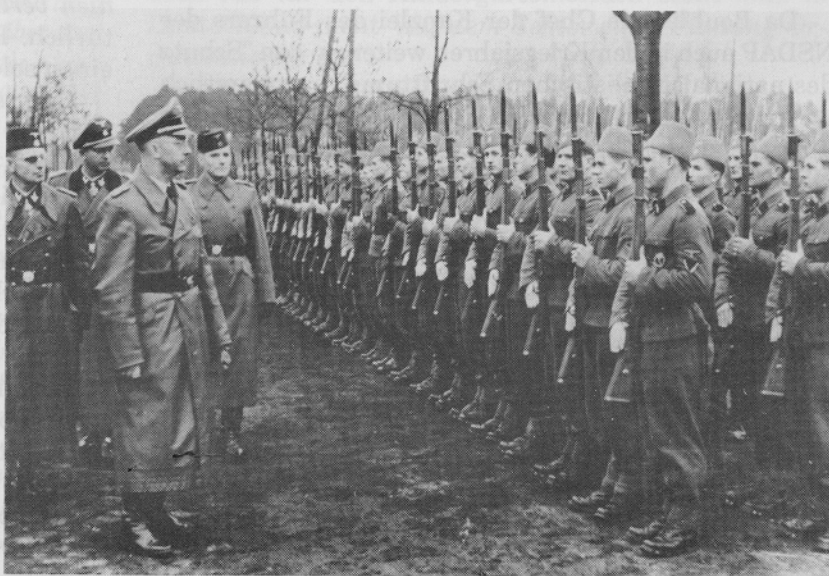
Himmler besucht 1943 Soldaten der Waffen-SS Gebirgs-Division "Handschar" (Kroaten)

Alfred E. Frauenfeld, einst Wiener Gauleiter, ab Okt. 1941 Generalkommissar für Taurien (Krim), schrieb nach dem Krieg ein eindrucksvolles und sachkundiges Buch über die damaligen Verhältnisse 13) . In diesen "Erinnerungen und Aufzeichnungen" hat er keinerlei Kritik zu falschen Maßnahmen auf deutscher Seite zurückgehalten, doch von einer Planung oder gar nur Andeutung, Südtiroler auf der Krim anzusiedeln, hat er nichts verlauten lassen. Wohl schilderte er, daß in Taurien einschließlich der Krim einst 78.000 Volksdeutsche beheimatet waren, deren Männer die Sowjets vor ihrem Rückzug entweder ermordet oder verschleppt haben.