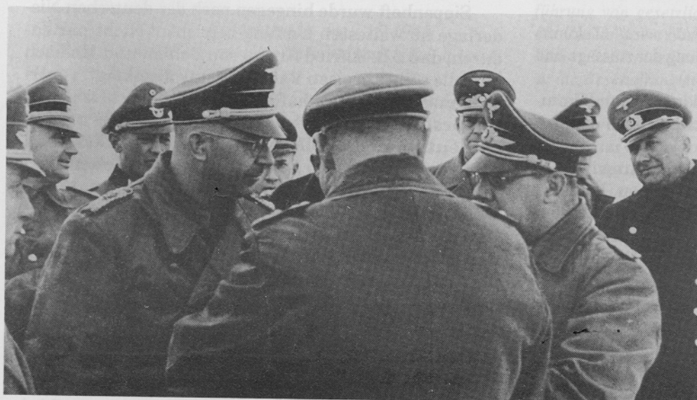
Der RF-SS im Gespräch mit höheren Luftwaffen-, Heeres- und Polizeioffizieren in Minsk 1942. Meinungsverschiedenheiten sind nicht erkennbar.

» 3 « "Wenn ein Ritterkreuzträger fällt,"